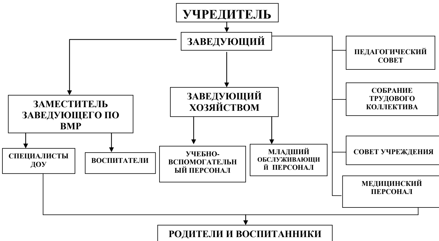
Табл.2 «Структура ДОУ»